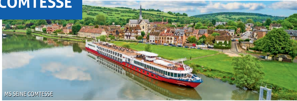
MS SEINE COMTESSE