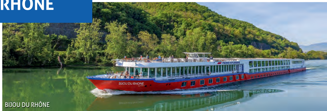
BIJOU DU RHÔNE