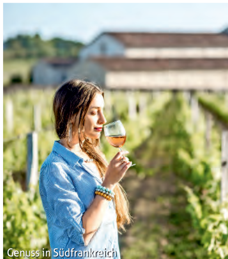
Genuss in Südfrankreich