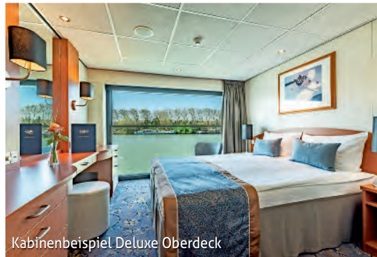
Kabinenbeispiel Deluxe Oberdeck