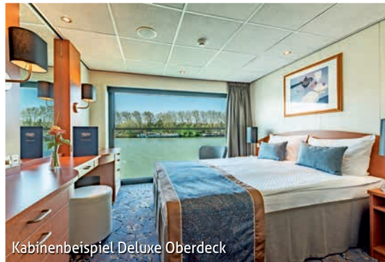
Kabinenbeispiel Deluxe Oberdeck