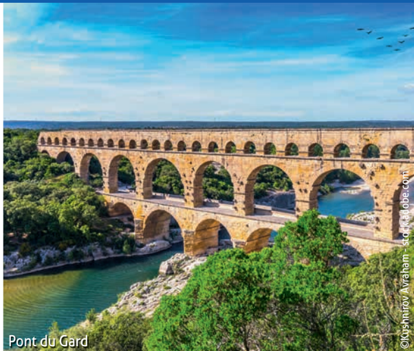
Pont du Gard